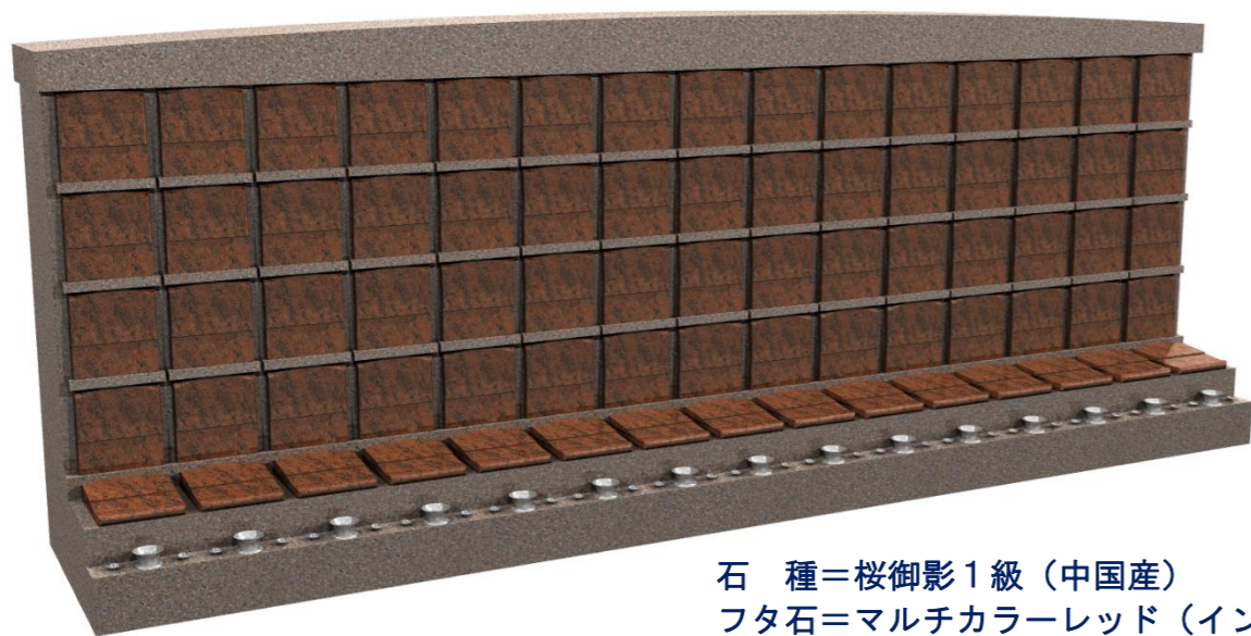
石 種=桜御影1級 (中国産) フタ石=マルチカラーレッド (インド産)