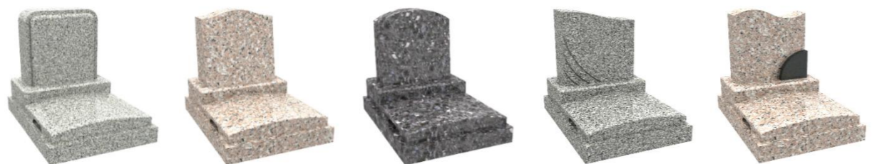
タイプ A タイプ B タイプ C タイプ D タイプ E